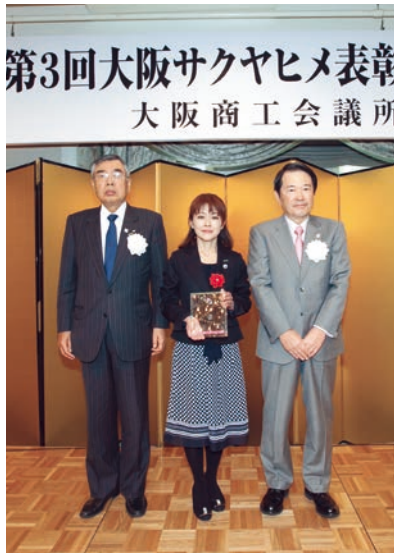
大阪サクヤヒメ大賞受賞者

2007年入社後、店舗惣菜担当・チーフを経験。入社6日目よりバイヤーとして本社勤務。男性社会の風土の中で、業務の効率化を提言し、女性もバイヤーとして働ける環境づくりに貢献した。2012年「女性活躍推進プロジェクト」初期メンバーに選抜され、女性のライフイベントに関するガイドラインを作成。ロールモデルとして、社内の風土・意識改革を行い女性活躍推進に努めた。現在、次世代バイヤー候補の育成にも注力する。