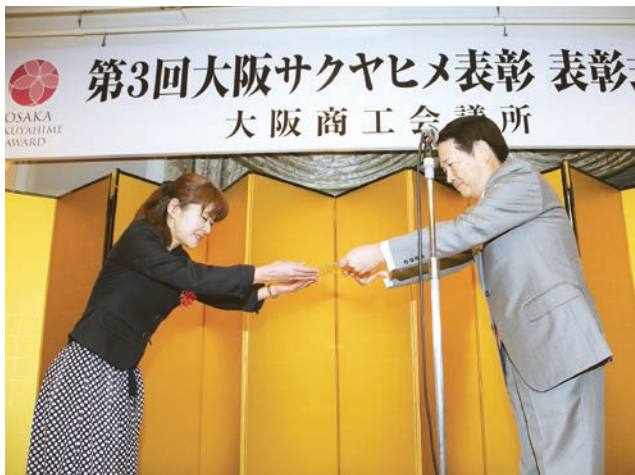
大阪サカヤヒメ大賞受賞者への表彰盾授与

証券会社・航空会社に勤務後、結婚・2児出産と6年間の家庭生活を経て、2007年アビリート株式会社設立。業務経歴を基に企業研修を主としたビジネス支援事業と、子どもに関わる教育支援事業を開始。また祖母の介護と仕事の両立の経験から、地域の潜在労働力を活用した地域相互扶助支援にも取り組む。年度毎に研修受注数を増加させ、2017年度は年間180件を受注。受講者満足度は常に98%以上を達成している。