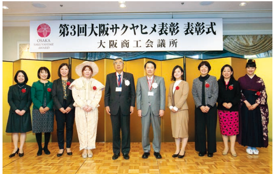
大阪サクヤヒメ賞受賞者