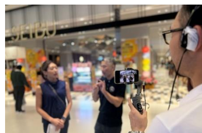
▲ インタビューの様子