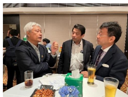
タイ企業とのビジネスマッチング (左)・ネットワーキング会 (右)