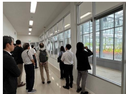
Eastern Economic Corridor of Innovation (EECi)