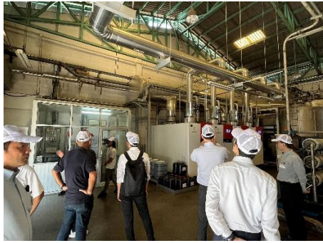
Parfun Textile (日系企業①)