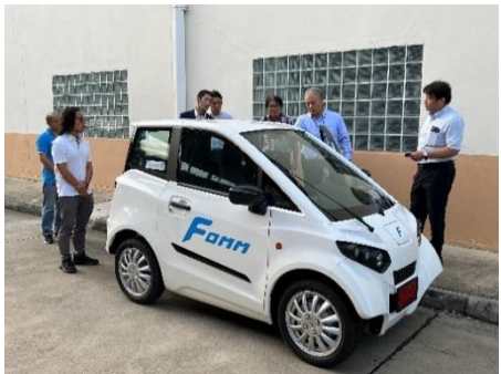
FOMM (ASIA) (日系企業③)